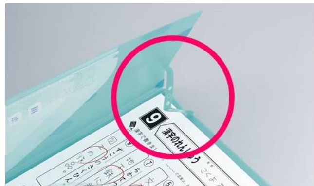
写真：脱落防止ストッパー