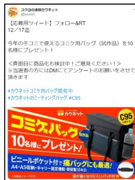
試作品をフォロワーに モニタリングしてもらっ キャンペーンを実施