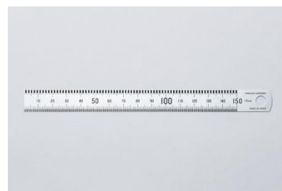
本当の定規（15cm）TTDA-BR02 1000円（税抜）

「NEXT QUALITY」をテーマに開催したコクヨデザインアワード2014では、次の時代の道具の質の提案を募集しました。本当に正確な1mmを計りたいというデザイナーの情熱から生まれた「本当の定規」は、決して大掛かりでないちょっとした発想の転換により、鮮やかに物を測る道具としての機能を究めた提案として高い評価を受けました。