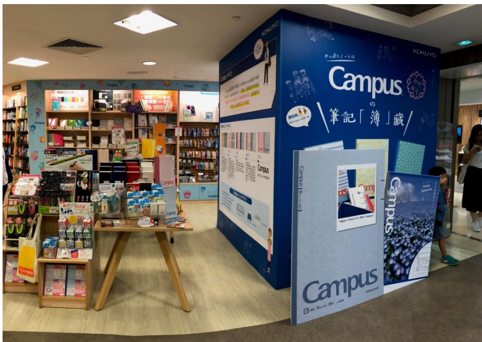
コクヨポップストア店頭の様子

また、コクヨのスタッフがお客様の相談にお答えし、それぞれのお客様にあった文具をご提案する「文具診断サービス」（無料）や、お客様のノートをデジタルデータにしてデジタル時代のノートの使い方（保存・閲覧方法）を提案する「ノートデジタル化サービス」（有料）も実施しています。