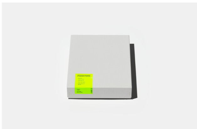
ZYABARA PAPER 500 SHEET