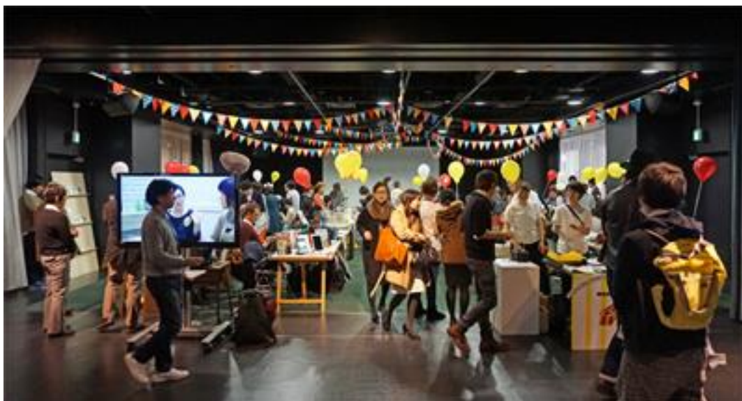
写真：昨年の MOV 市の様子