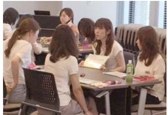
グループ3社・16人の女性社員が5時間にわたって討議

過去の振り返りや今の仕事の魅力は何か、これからどうなっていきたいか等普段なかなか考える機会が少ない内容ながら、業務から離れた場で議論することで今後の自分への考えを深め、また会社を越えた交流によって互いに刺激を受けることができました。