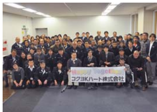
障害者39人を含む86人が勤務(2016年3月末現在)

すでにステーションナリー事業本部からは、開発書類作成や市場分析などの業務移管が進んでおり、「障害者が担う業務＝単純作業」という概念を打破するさまざまな事業にチャレンジしています。