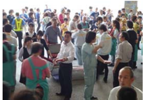
熱中症対策でアイスクリーム配布(近畿IDC)

また、各センターの特性に合わせた独自の啓蒙活動も実施しています。コクヨサプライロジスティクスでは、センター内で働くパート・アルバイトの方々に夏場の作業を乗り切ってもらうために、毎年、工夫を凝らしながら対策をしています。パート・アルバイト数の多いセンターでは400人程いますが、過去には、クールスカーフ・スポーツタオル・塩飴・スポーツドリンクなどを配布してきました。近年では、一斉に作業を一時中断してイベントと銘打って「アイスクリーム」を配布し、暑い夏に一息つきながらクールダウンをしてもらっています。パート・アルバイトのコミュニケーションの場としても活用することでセンター運営が円滑に進むように目指しています。