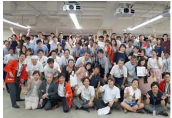
2年ぶりに開催されたビアパーティに過去最高の270人を超える社員が参加した

コクヨ労働組合は、2014年から「ワーク・ライフ・アドバンス↑」をキーワードにさまざまな活動をしています。「仕事の価値」を上げて効率的に働き、オフの時間をより豊かに過ごすことで「生活の価値」を上げ、そこで得た知見でさらに「仕事の価値」を上げるサイクルを回し、個人の成長が企業の成長に繋がっていくことを目指しています。