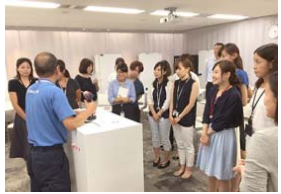
収納庫の上下裏側構造の変更や部品取寄せの際の注意点などをわかり易く紹介

お客様と円滑なコミュニケーションをとるために今後もこうした研修を継続的に開催し、お客様のお問い合わせに正確に対応していくことで、ココヨファンを増やしていきたいと思っています。