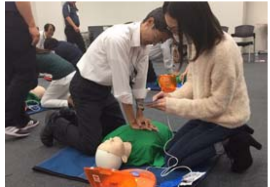
人形を使って行ったAED訓練

なお講習会に先立ち、応急救護知識向上に努めたとして、9月12日に高輪消防署より感謝状をいただきました。