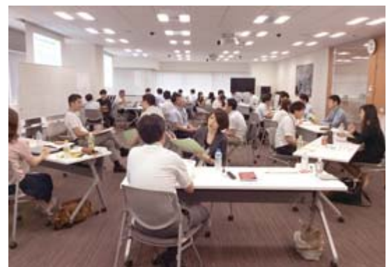
2016年は大阪と東京で16の企業が参加

研修プログラムは参加各社の事務局が意見を出し合い、高質なプログラムを厳選していて、参加者アンケートでも満足度の高い結果となっています。特にコクヨと違った価値観に触れ合え、違う業界・業種の「異業種の人財との交流」が大きな魅力で、貴重な人脈形成の機会になっています。