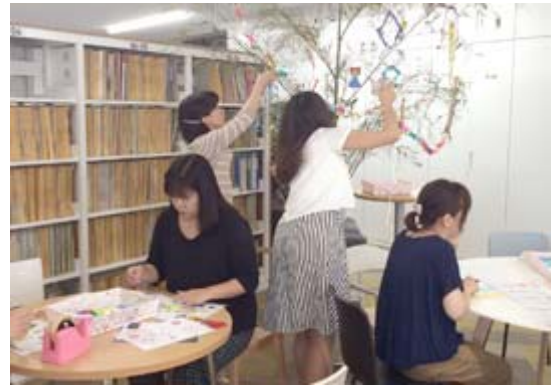
今回は本社の新館XT(クロス)と三重配送の2箇所で開催

「らしく×らしく」では、他にもさまざまな研修・イベントなどを企画しています。今後もココヨロジテムでは、ダイバーシティ推進と女性活躍を目指していきます。