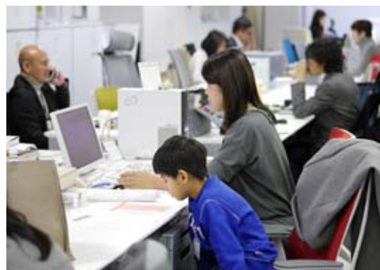
お母さんの職場で一緒に自習をする子ども

参加した子どもたちへのアンケートからは、働く親を応援する気持ちが高まった、といった意見が多く寄せられました。今回のトライアルで得た経験やアンケートの結果を生かし、さらにさまざまな取り組みにチャレンジしていきたいと思えます。