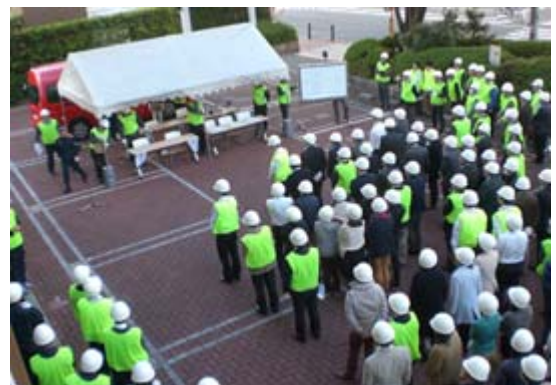
避難場所に集合(大阪本社)