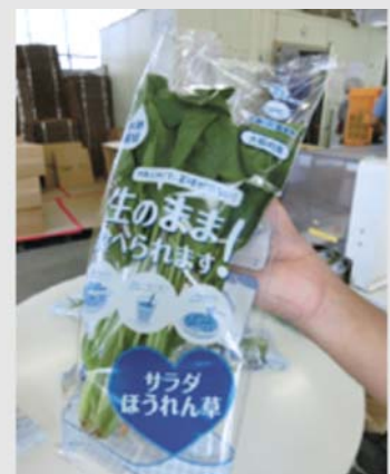
ほうれん草特有のえぐみやアクが少なく、下ゆでなしで生のまま食べられるサラダほうれん草