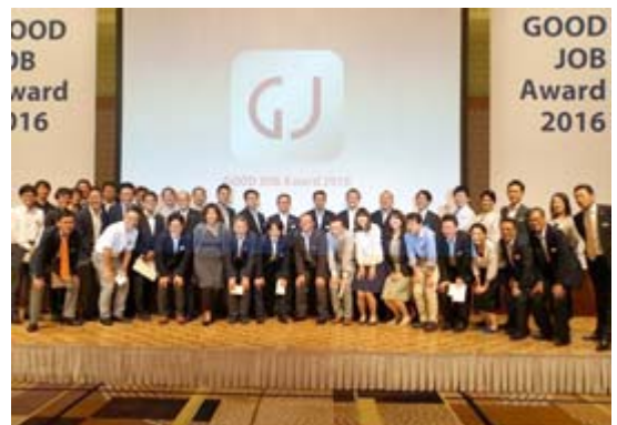
「いいね！アワード2016」業務部門「Good Job!賞」受賞者の記念撮影(東京)

今後も、ファニチャー事業特有の長いバリューチェーンを支えているさまざまな人への感謝の思いを互いに持ちながら、このようなイベントを通じて、一体化を強化していきたいと思っています。