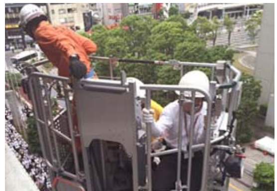
はしご車での救出(品川オフィス)

さらに社内ネットワークに「コクヨの防災」のページを開設し、「従業員向け非常時マニュアル」、「サバイバルカード」などを収録し、災害発生時の対応、行動を周知させています。