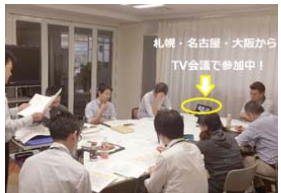
全国を繋いだテレビ会議による勉強会を定期的で開催

仕事で時間がとれなかったり模擬試験で伸び悩んだり受験者の悩みもいろいろありましたが、受験者同士で勉強方法を共有したり上司と業務調整をするなど、全社をあげてサポートする風土が生まれたことがこの成果に繋がっています。