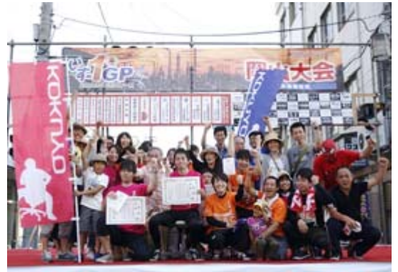
倉敷市水島地区にある常盤町商店街内特設コースを会場に開催された「第2回岡山大会」

2016年は、「九州大会」(長崎県・大村市)に参戦したココヨマーケティング九州選抜チームが3位、「岡山大会」(倉敷市・水島)にはココヨ山陽四国販売が参戦し、2位と1周差の大接戦で優勝しました。そのほか、「北海道大会」(千歳市)ではココヨ北海道販売が自衛隊チームに次ぐ2位、「一関大会」(岩手県一関市)ではココヨ東北販売が2位、「福井大会」(鯖江市)にはココヨ北陸新潟販売が初参加で4位(県内最高位)など、特筆すべき結果が多数ありました。今後も地域活性化の一環として、各地のいすー1グランプリへ積極的に参加していきます。