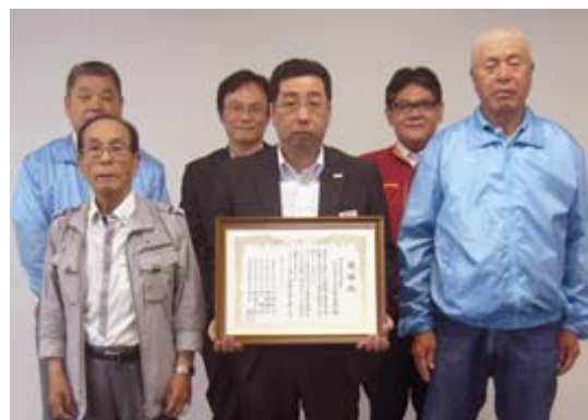
感謝状をいただいた南港四連合町会地区協議会の皆様とともに

今後は小中学校に対する防災防犯活動にも積極的に参加していき、今以上に地域との交流を深めます。