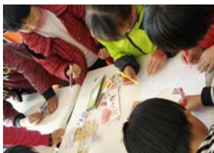
コクヨ文具で夢を描いている様子