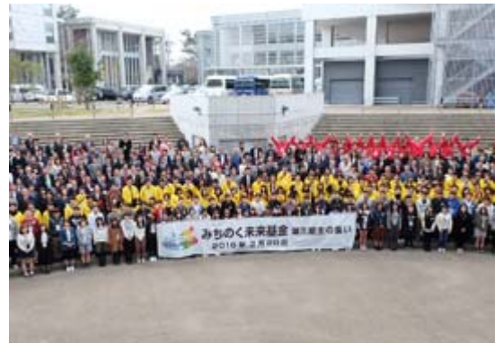
3月には新入生の進学と在籍生の卒業をサポート・関係者で祝いイベントも開催

7月に行われた基金事務所の移転に際しては、奨学生たちが集いやすい空間づくりをデザインするとともに、家具備品を寄贈いたしました。