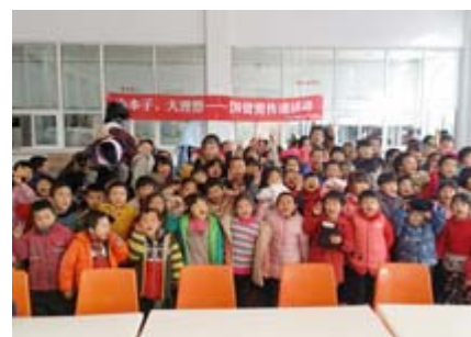
寄付衣装を着てくれました