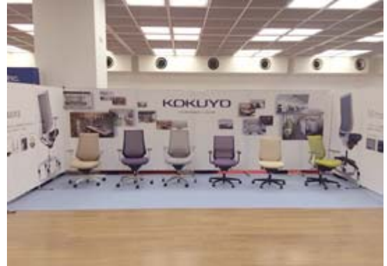
会場ではファニチャー新製品のオフィスチェアを展示

2月24日～26日、「JFMA FORUM(日本ファシリティマネジメント大会)」が開催されました。本フォーラムは、日本でのFMの普及定着を図ることを目的に、公益社団法人日本ファシリティマネジメント協会(JFMA)が毎年開催しており、コクヨもJFMA会員として毎年参画しています。今回、コクヨはファニチャー事業部門のワークスタイル研究所や提案マーケティング部などが主体で参画し、最新の自社取り組み事例の訴求・展示を行ったほか、各種セミナーへ登壇、講演を行いました。今後も、業界団体と連携しながら、日本でのFMの普及定着に積極的に取り組んでいきます。