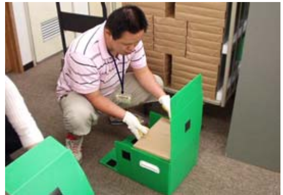
段ボール箱の代わりになるプラスチック製の箱で配達します。

滋賀県に事業所のある企業・団体の皆様、環境・福祉の先進県「滋賀県」オリジナルのCSR活動に参加してみませんか。