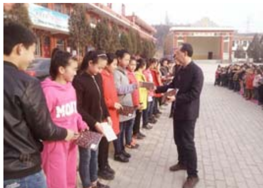
先生からキャンパスノートを受け取った子どもたち

コクヨグループでは、開発途上国の多様なニーズに応えるため、1989年に導入された外務省主催の「草の根・人間の安全保障無償資金協力」(以下、草の根無償協力)に、2006年より協賛しています。草の根無償協力は、中国の恵まれない地域の子どもたちにも都市部の子どもたちと等しく学んでもらうための機会・環境をつくる活動です。多くの賛同企業による無償援助により、校舎の建築や学用品提供が行われ、これまでにさまざまな事情により十分に学ぶことができなかった子どもたちにも教育を受けてもらえる場所・道具を提供しています。この取り組みに、コクヨはキャンパスノートの提供によって協力しており、2016年、3万冊のノートを50カ所の学校に進呈。寄贈を始めた2006年からの10年間では、累計56万冊を超えるノートを寄附しています。