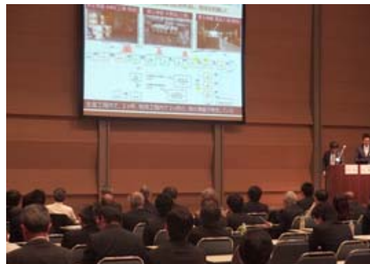
グループ内でのサプライチェーン密着による改善活動が評価

今後も担当業務だけでなく会社の枠を超えた取り組みを進め、ロジスティクス起点でグループの事業を盛り上げるよう継続していきます。