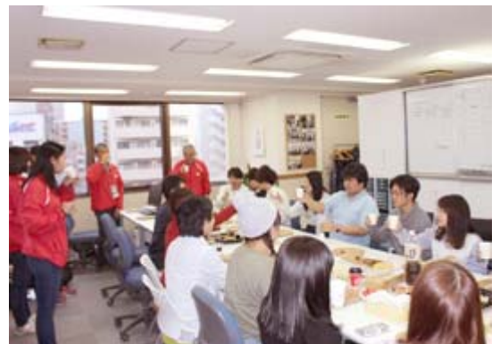
新事務所に移転後、多くの奨学生が気軽に立ち寄ってくれるようになりました。