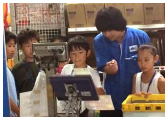
初めての物流作業体験に真剣に取り組む子どもたち

当日は小学生15人(保護者の方を含め全員で27人)が参加し、実際のデジタルピッキング作業も体験してもらいました。この見学会を通して、たくさん子どもたちがコクヨファンになってくれたらと思います。